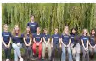
Entental Gymnasium, Bietigheim