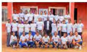
Queens Model School, Nigeria