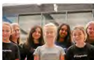
FvAG, Bad Friedrichshall