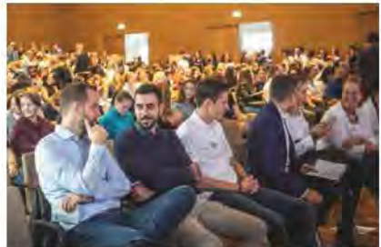
Bilder vom 1. SDG Jugendgipfel 2019 in Heilbronn, Bildungscampus