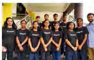
CSME Kawarsadi, Indien

Die Schulen werden sich auf dem 2. SDG-Jugendgipfel präsentieren und ihre Ideen vorstellen. Der Austausch und die Zusammenarbeit zwischen den verschiedenen Schulen und Kulturen sind von unschätzbarem Wert und tragen dazu bei, eine nachhaltigere Welt zu schaffen.